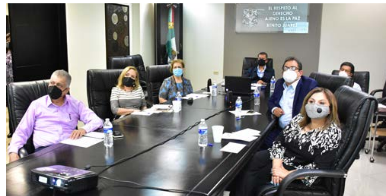
Primer Encuentro Nacional Digital "Desafíos de la Justicia Mexicana".

La coordinación con los Poderes Legislativo y Ejecutivo, redunda en un trabajo interinstitucional. En tal sentido, la Presidencia de este Tribunal participó en 45 reuniones diversas con los otros poderes del Estado. Como apoyo en las