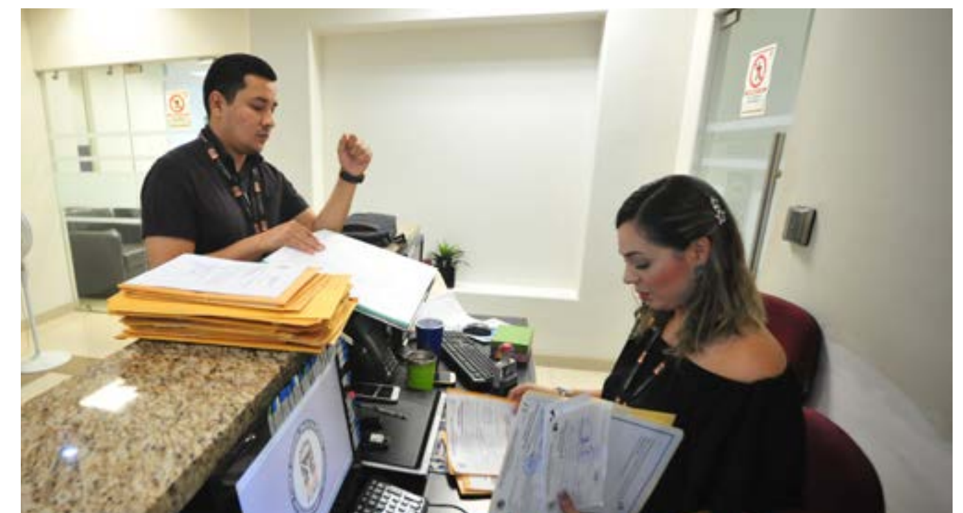
Recepción de documentos de la Coordinación de Peritos.

En este contexto, en el periodo a informar se describen todas las acciones sustantivas realizadas, así como otras actividades que en conjunto, son testimonio de la importante labor de la institución, la cual tiene entre sus fines fundamentales, el desarrollo y la administración de un sistema de