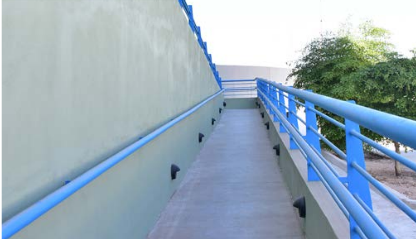
Rampa de acceso al edificio del Poder Judicial en el Centro Cívico de Mexicali.