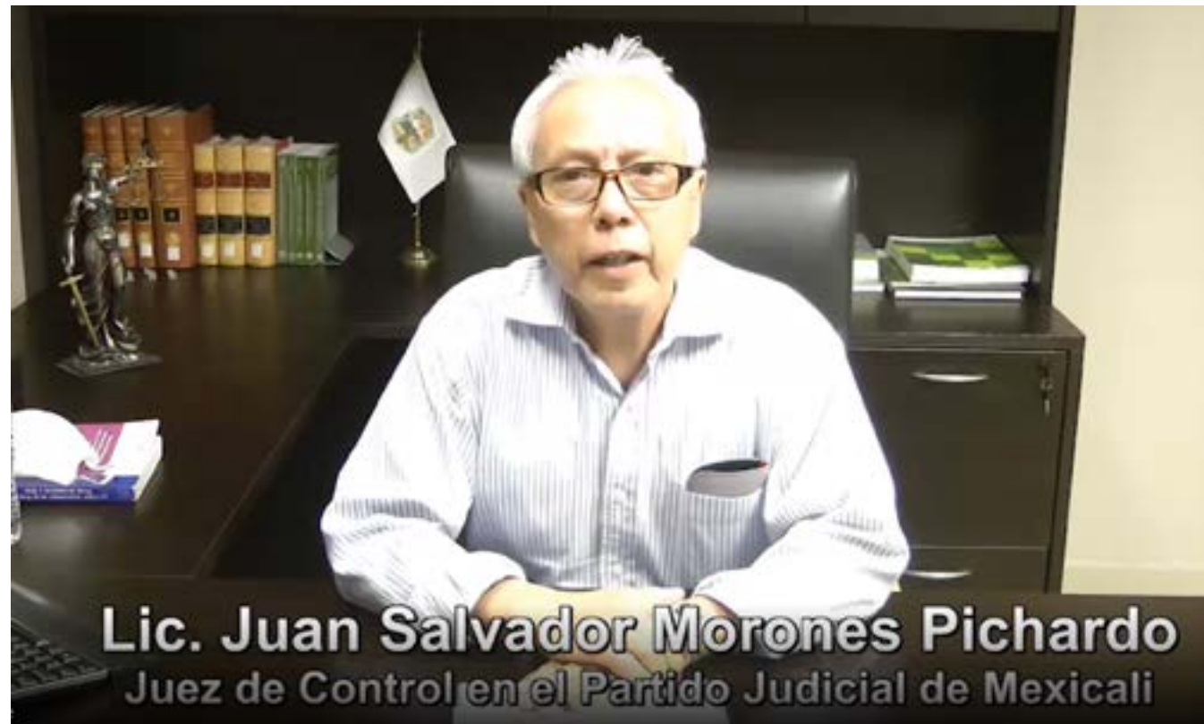
Conferencia Virtual: La Audiencia Intermedia en el Proceso Penal.

por usuarios tanto internos como externos a la institución, llevando a cabo 8 préstamos de material, 14 requerimientos de localización y la difusión de 2 mil 664 oficios y correos electrónicos, sobre decretos publicados en el Diario Oficial de la Federación y el Periódico Oficial del Estado; esto es, para conocimiento de Magistrados, Consejeros, Jueces, Secretarios y Titulares de las Áreas Administrativas del Poder Judicial.