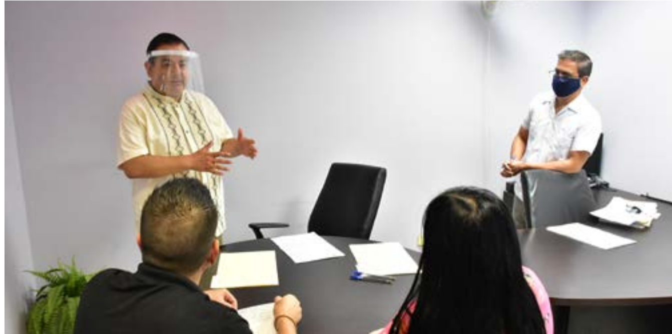
Firma del primer acuerdo familiar llevado a cabo de manera virtual en el contexto de la Contingencia Sanitaria.

medios alternativos de solución de conflictos, así como la prestación del servicio de orientación sobre las instancias jurisdiccionales competentes para resolver los conflictos que se susciten entre las partes, cuando no obtengan un arreglo satisfactorio mediante los medios alternativos y toda actividad tendiente al desarrollo de la cultura de la justicia alternativa.