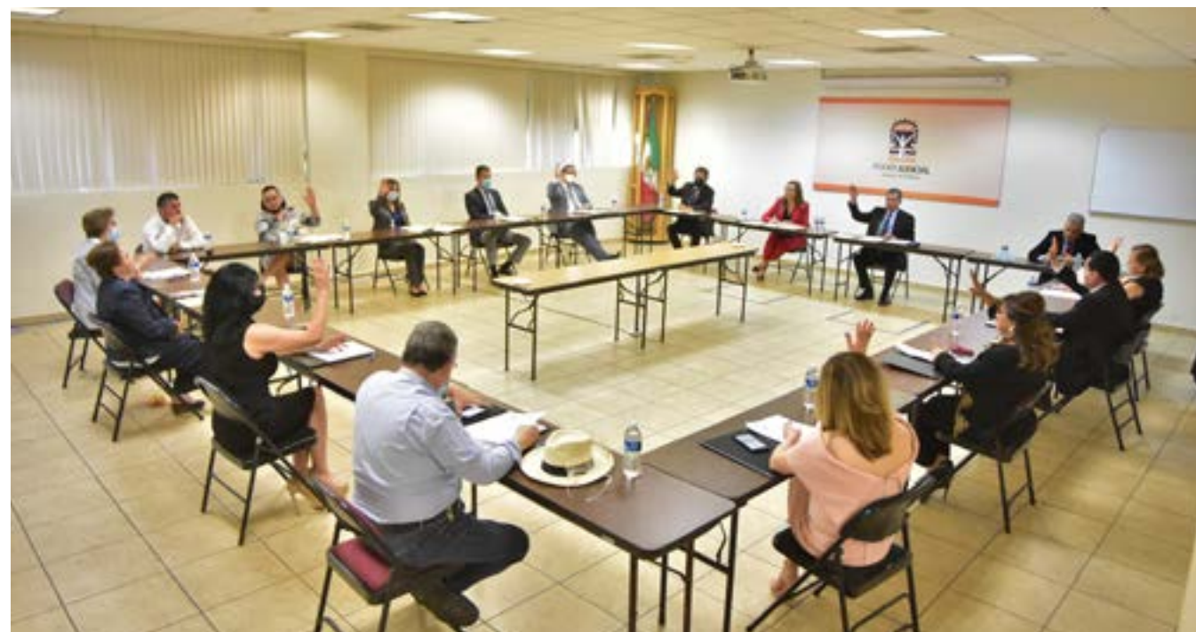
Sesión del Pleno del Tribunal Superior de Justicia del Estado de Baja California.