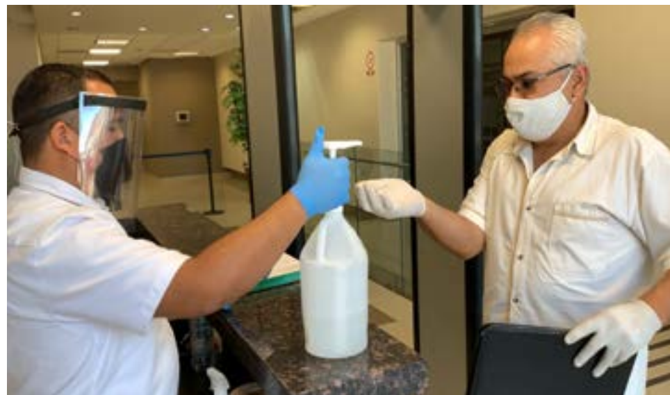
Implementación de filtros sanitarios para el acceso de usuarios y personal que labora en el Poder Judicial del Estado.

Con respecto a los bienes muebles correspondientes a las ciudades de Tijuana y Mexicali, se efectuaron depuraciones de bienes, arrojando un total de 287 bajas de activos fijos, con un importe de $1,036,765.75 pesos moneda nacional.