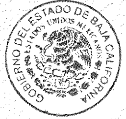
TRIBUNAL SUPERIOR DE JUSTICIA SECRETARÍA GENERAL DE ACUERDOS